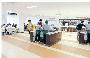
杉谷キャンパス食堂