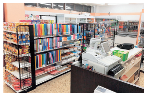
高岡キャンパス購買