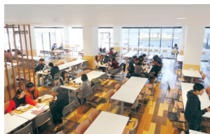
五福キャンパス食堂